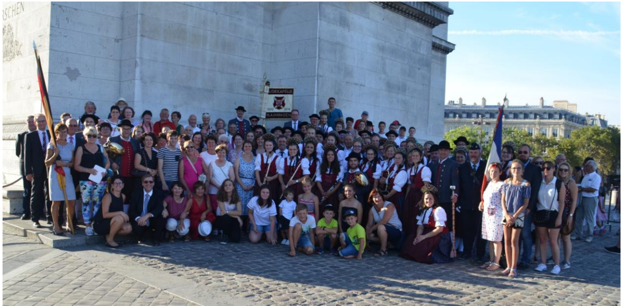
Erinnerungsfoto aller Teilnehmer von Farbus und Maihingen