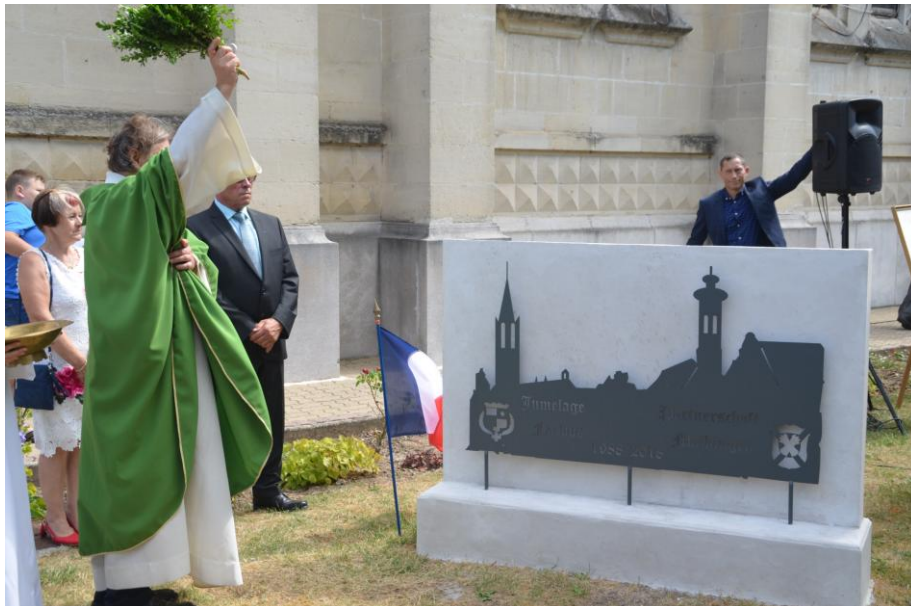
Segnung des Erinnerungssteines der Gemeinde Farbus zum 30-jährigen Jubiläum