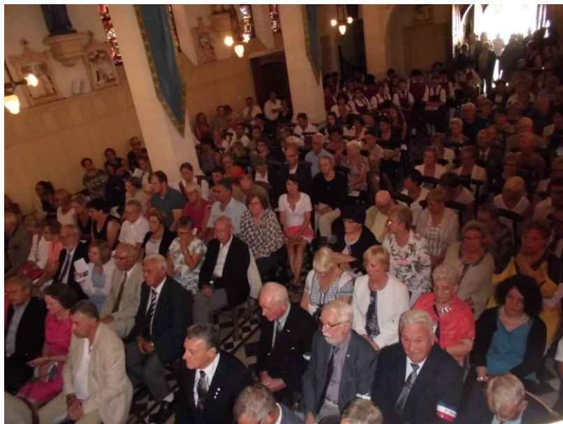
Gottesdienst in Farbus