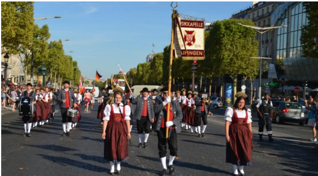
Marsch auf der Champs Elysee zum Triumphbogen angeführt von der Musikkapelle Maihingen