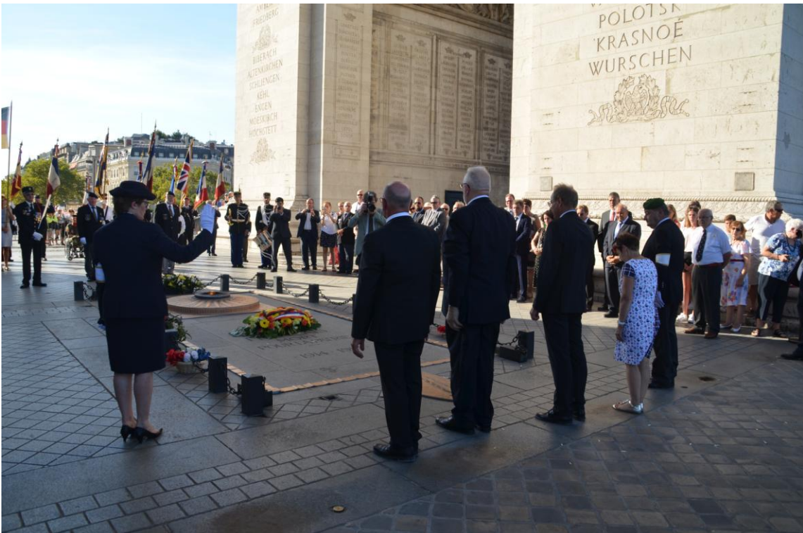
Kranzniederlegung Farbus und Maihingen am Grab des unbekannt Soldaten des Ersten Weltkrieges