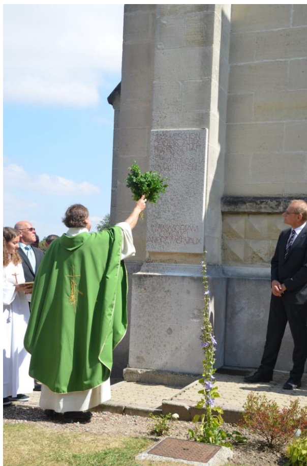
Segnung der Erinnerungstafel der Gemeinde Maihingen zum 30-jährigem Jubiläum