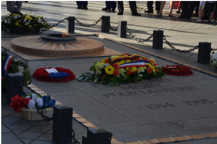
Grabmahl unter dem Triumphbogen mit der Flamme der Erinnerung