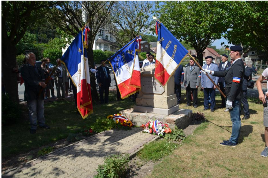
Kranzniederlegung am Kriegerdenkmal