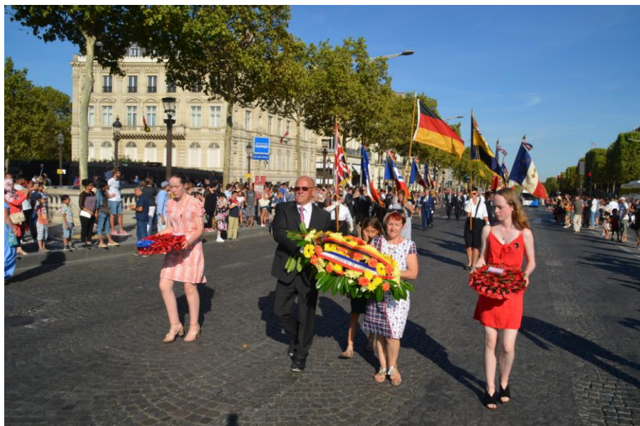
Blumengebinde für die Niederlegung am Triumphbogen