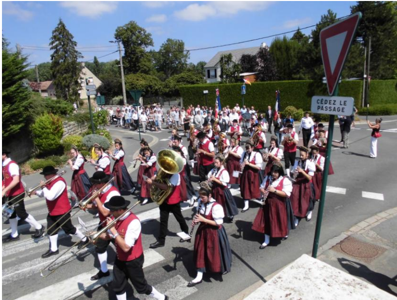
Zug zum Friedhof