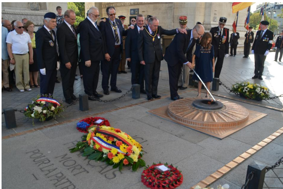
Wiederentflammung "Flamme du Souvenir" in Gedenken an die Toten, die nie identifiziert wurden