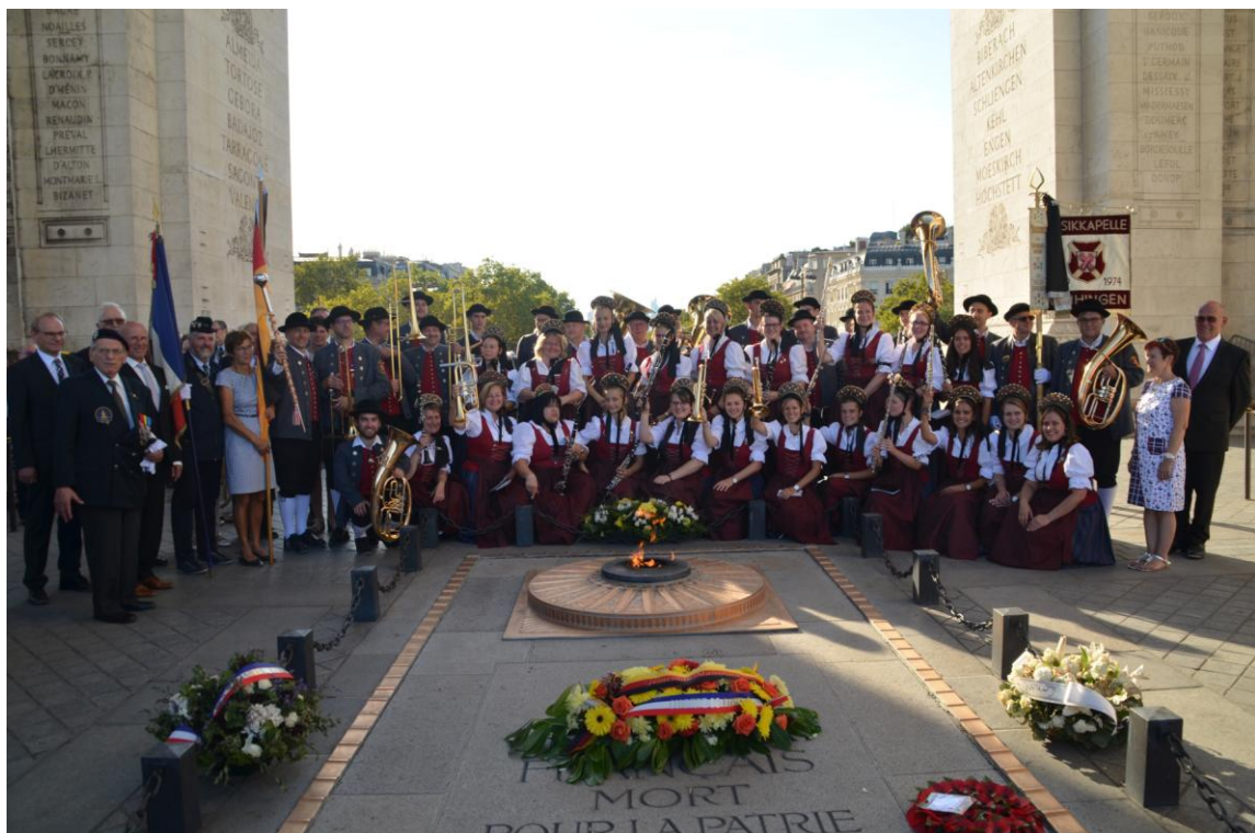
Erinnerungsfoto unter dem Triumphbogen